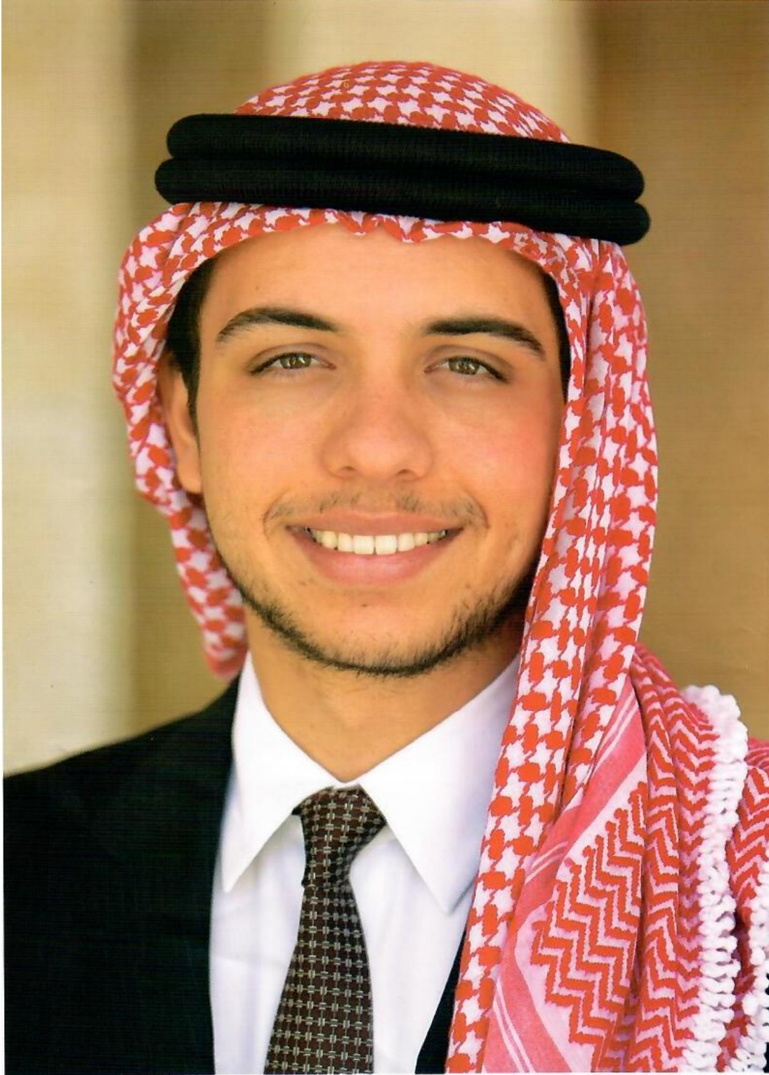
سمو الأمير حسين بن عبد الله الثاني ولي العهد المعظم