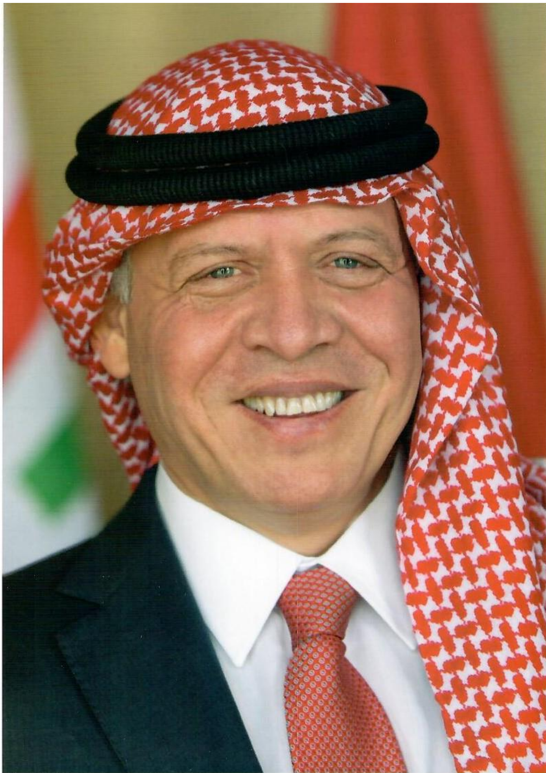
حضرة صاحب الجلالة الهاشمية الملك عبد الله الثاني بن الحسين المعظم